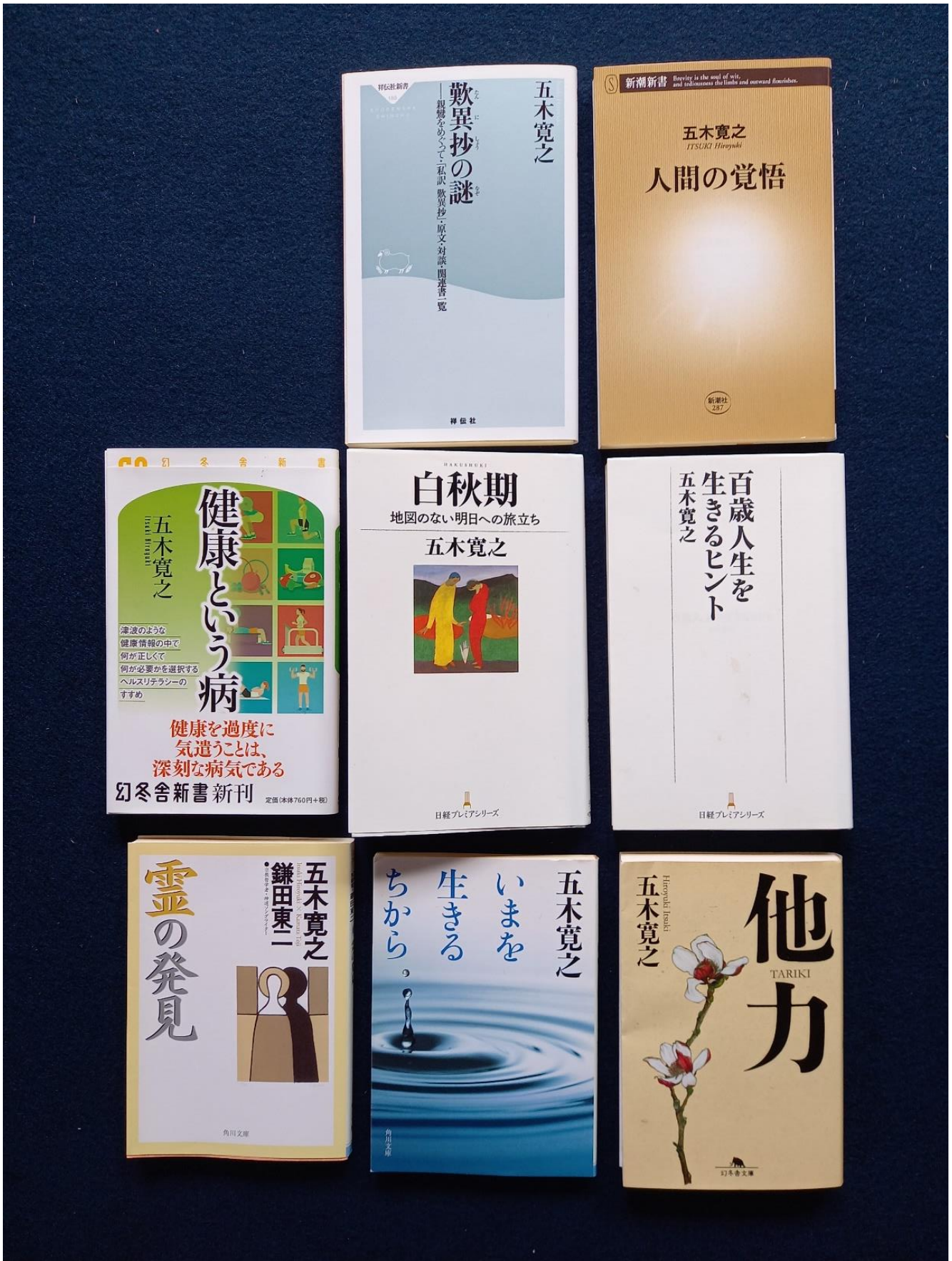
早速、古本屋で買った本